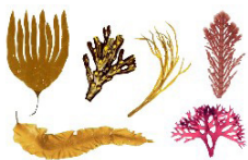
Algas rojas y pardas