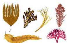
Algas rojas y pardas